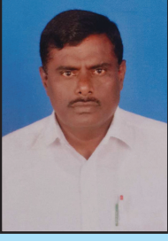
முனைவர் நொ கா கந்தசாமி மாநிலத் தலைவர்