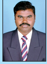
முனைவர் க இரமேஷ் மாநில இணைச்செயலர்