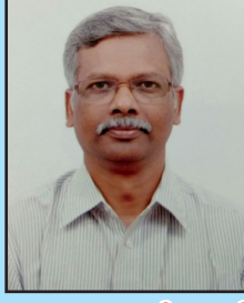
முனைவர் த வீரமணி மாநிலத் துணைத்தலைவர் / குழுத்தலைவர்