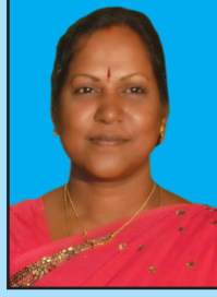
பேரா. த மதுரம் இணைச்செயலர் (மகளிர்)